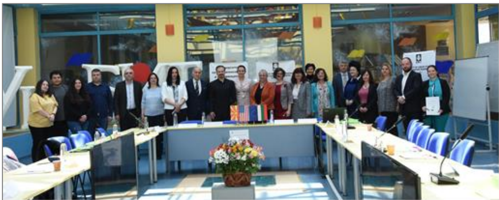
Обща снимка на участниците в Девети научен семинар с международно участие „Интелектуалната собственост и новото (не)нормално“