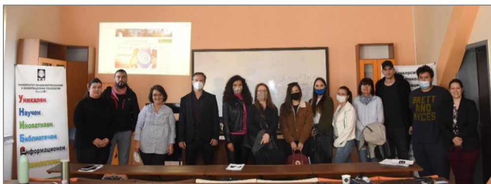
Участници в специализирания курс по авторско право на Харвард CopyrightX