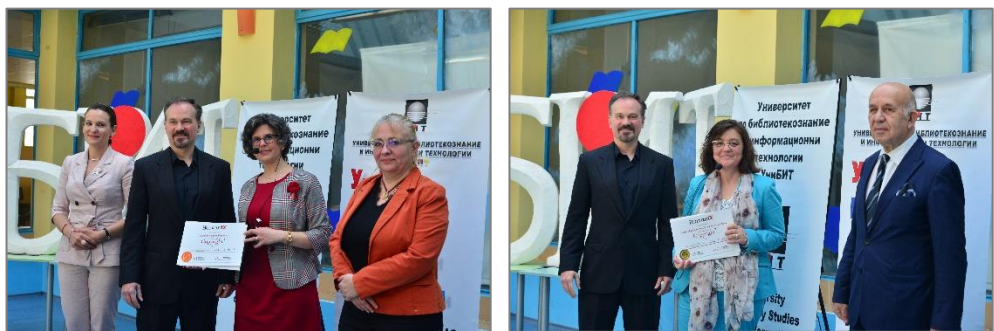
Връчване на сертификати на участниците в курса CopyrightX