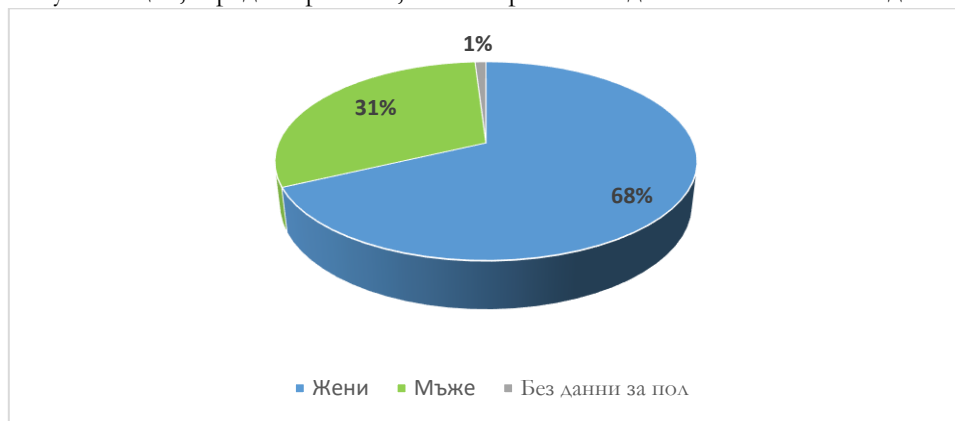
Фиг. 1 Разпределение на харесванията на Facebook страницата по пол