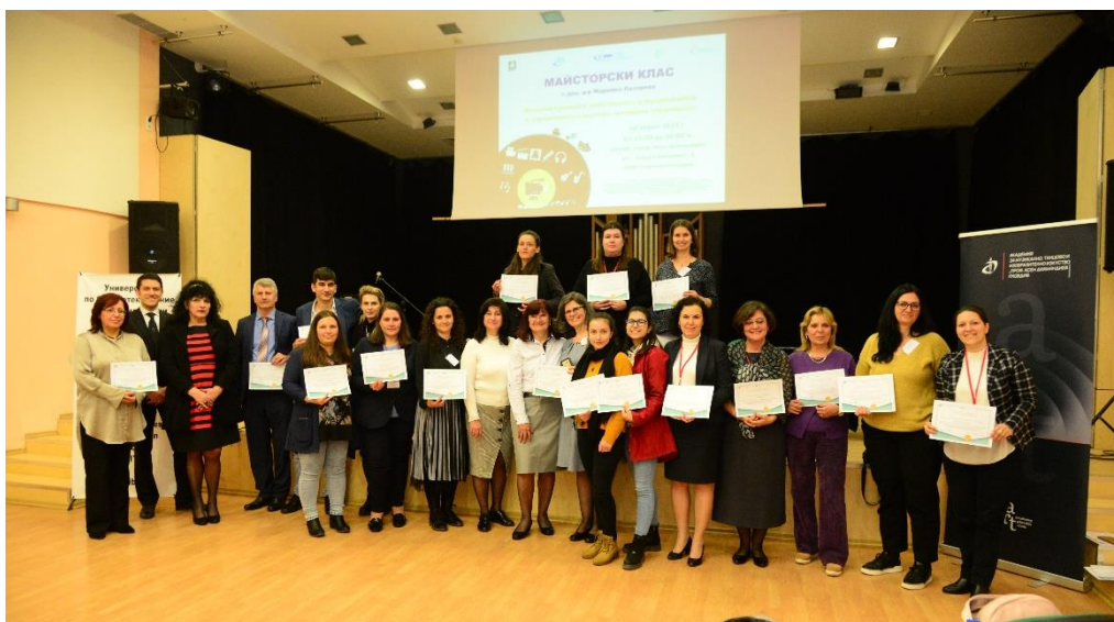
Обща снимка на участниците в Майсторския клас