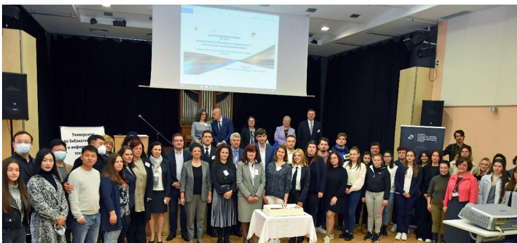
Обща снимка на участниците в Десети национален семинар „Интелектуалната собственост в университетите – нови хоризонти на академичния диалог“